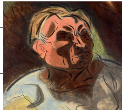
André Masson, Autoportait .